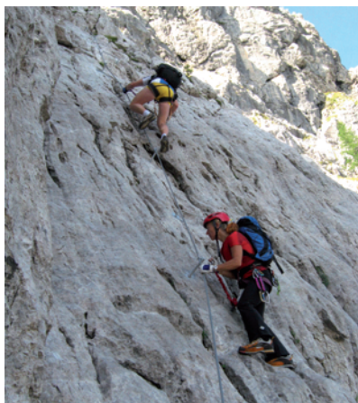
Oben: Einstiegsplatte (B/C); unten: im Mittelteil (D)

Tipp: Kürzer ist der Abstieg über den Winkelturm Ostgrat (B, siehe D/g/2): Ein kurzes Stück oberhalb des Ausstieges vom Klettersteig Torre Clampil auf dem markierten Steiglein links (in Richtung Osten) zu einer kl. Scharte (kurz vorher beginnen die ersten Sicherungen) queren und absteigen. Danach in Kürze zum Winkelturm (2040 m) und den Sicherungen bergab folgen (durchwegs A bis B) zum Wandfuß (siehe auch Topo und Wandfoto). Weiter im Geröll zum Sattel absteigen und Wiederaufstieg zur Bergstation Madritsche; insgesamt ca. 1 Std.